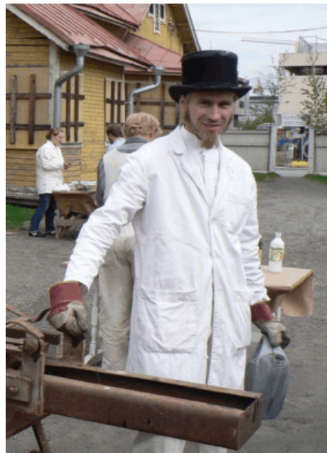
Puheenjohtaja ja tiilikone