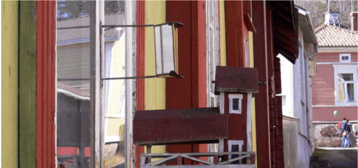
Vanhojen talojen loistoa Loviisassa